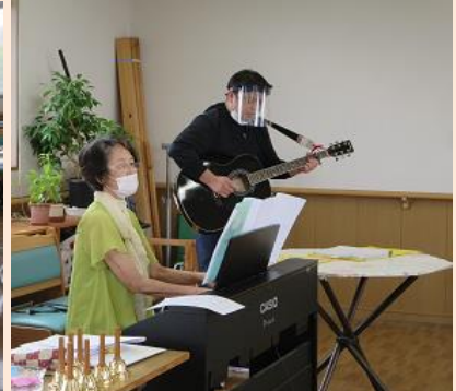
音楽療法 第1,3木曜日 頑張ってみんなで音を合わせます 楽器の生の音は良いです♪