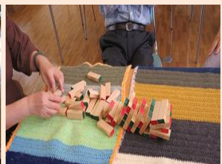
みんなの活動(不定期) そーっと そーっと(ドキドキ) がっしやーん! 何をするかみんなで考えます 「ジェンガ」ってご存知ですか?