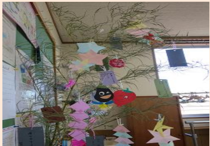
七夕かざり みんなで飾りつけをしました 短冊の願い事がかないますように…