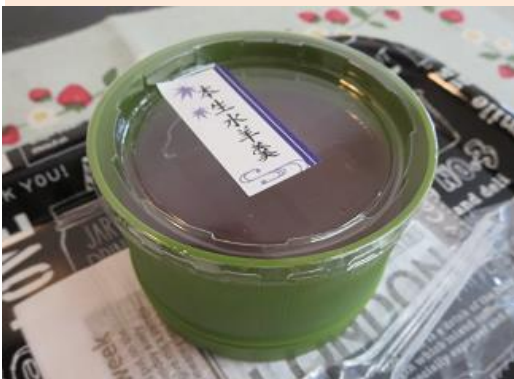
デイケアカフェ(月1回) デイケアの活動について意見交換会 今月のおやつ 涼しげな水ようかん