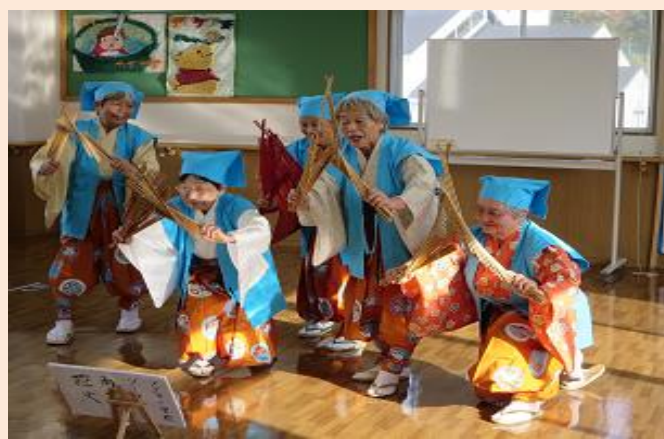
大阪狭山市 社会福祉協議会からお福会さんにお越しいただきました「南京玉すだれ」