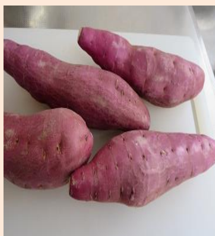
健康試食会 炊飯器で作る ほくほくやきいも