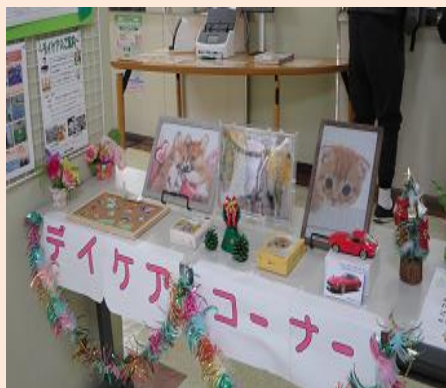
デイケアコーナー 病院の外来受付の前です