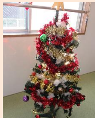
ツリー飾り付け完了 クリスマス待ち遠しいです