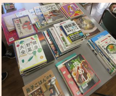
デイケア文庫(大阪狭山図書より) 料理本とダイエット本が人気です