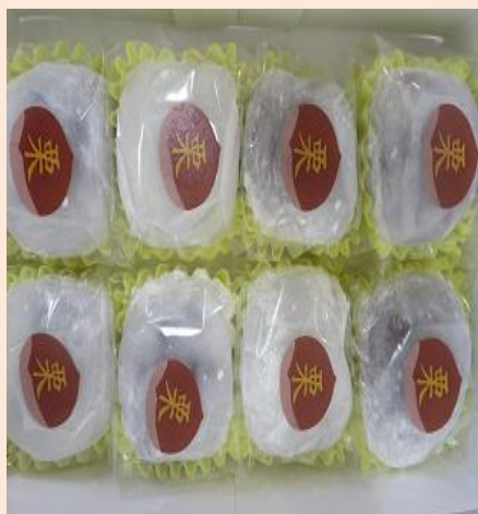
デイケアカフェ(月1回) 栗大福おいしかったです